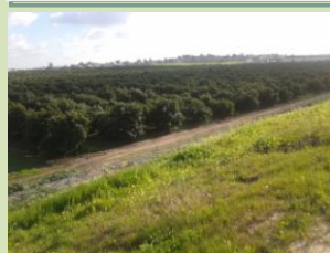
הסוללה נשקפים ענפי המשק