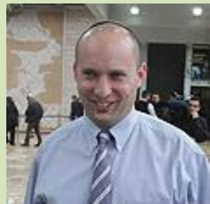
להכניס שכינה לחשבן הכנסת