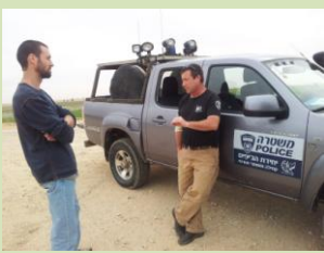
התארגנות היא הפתרון עד שהמדינה תתעשת