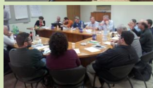
ערבות הדדית, רק בתוך הקיבוץ?