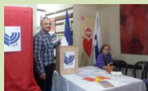
חסע בחירות אחר