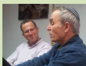
ביטוי לרוח הטובה