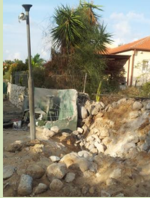
כל קיבוצינו שבאזורים המותקפים התארחו או מתארחים