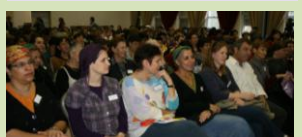
למרות הקושי מחשיכים עם המבט קדימה