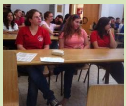
100% מהנוער שלנו מצהיר – שנת שירות לפני צבא