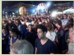
היינו התי מעט שחבשו כיפות

בשילוב כוחות עם מחלקת הדור הצעיר ומדרשת תורה ועבודה יזמה מחלקת הביטחון סדרת מפגשי תוכן לבנינו ובנותינו שבמסלולי י"ג השונים (מתנדבי שנת השרות יג"ל, תלמידי המכינות והמדרשות וכד'). התוכנית קושרת את הבנים והבנות לקיבוץ הדתי, מעוררת לשיח ערכי ומכוונת לערנות ומעורבות חברתית. בכוננתנו לקיים 6 מפגשי תוכן, ובסיומם – בחודש מאי – לסיים את התוכנית במסע משימתי בן יומיים. פרטים מדוייקים יפורסמו בקרוב בקיבוצים ובתאי הדואר של כולם. את המפגש הראשון נקיים בעז"ה ביום ראשון ד' בכסלו, 18/11, בקיבוץ בארות יצחק, בין השעות 19:30-22:30, תחת הכותרת: "החיים זה לא קיבוץ – אז מה הם?" עיסוק בחווית ה-י"ג. בתוכנית הופעה של להקת נהגי הפרדות, תיאטרון פלייבק ועוד. הרשמה במשרדי הקיבוץ הדתי (עדנה), ואנו מצפים לכל בנות ובני י"ג.