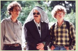
החיים זה לא קיבוץ. אז מה זה?