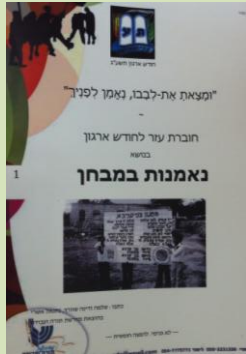
נאמנות או מרד קדוש?