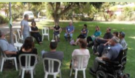
המכנה המשותף: קליטה חובה קיומית!