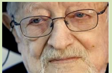
חיים חפר | 1925-2012