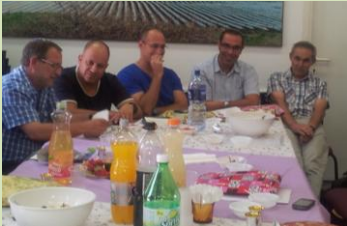
בסיום ההערכות הרמת כוסית עם כל העובדים