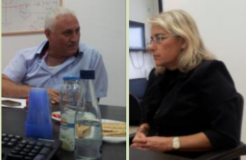
פקידות בכירה ביותר השתתפה בדיון

המחלקה לצמיחה דמוגרפית מארגנת יום עיון בנושא קליטת בנים. יום העיון יעסוק במכלול הסוגיות הקשורות בנושא: האם לקלוט את כל הבנים? האם לקלוט רק בנים או לפנות גם לקליטה חיצונית? שאלת זהות הקיבוץ מול קליטת כל הבנים ועוד. יום העיון יערך בעז"ה ביום שלישי ל' תשרי תשע"ג, ר"ח חשוון, (16.10) בבית המדרש בקיבוץ עין צורים. יום העיון מיועד לרכזי וחברי וועדות: קליטה, בנים, צעירים וצמיחה דמוגרפית. הרשמה מוקדמת מומלצת, בטלפון 03-6072706 (עדנה, מזכירות הקיבוץ הדתי).