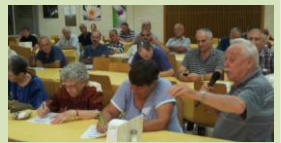
שמענו הסברים למה לא להתפקד ולא השתכנענו!