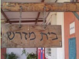
אין מקום לכל המבקשות ללמוד במדרשה