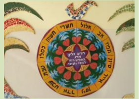
חידושים רבים בבית ספר שק"ד