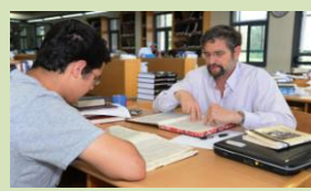
זמן אלול בתפוסה מלאה