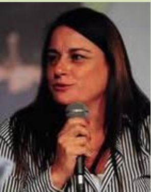
יודעי דבר אומרים: "לא נשארה עין יבשה באולם"