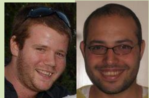
נושאי המחקר של העמיתים שונים ומגוונים