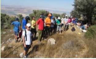
גדודי עבודה תשע"ב: ידיים מיובלות וזיעה ניגרת