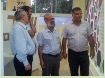
משימות חשובות ורבות בחזית החינוך