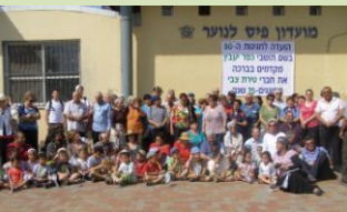
התלהבות וניצוץ בעיניים