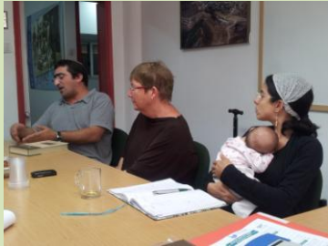
סוקרים את העשייה המבורכת