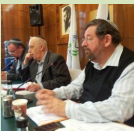
מעורבות בתנועת האם