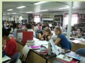
ראש מדרשה חדש