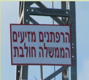
סכנה ברורה וחיידית!

פרטים אצל מוטי רבהון: mrebhun@fermentek.com (050-323-1065).