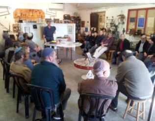
כל חפץ נושא סיפור