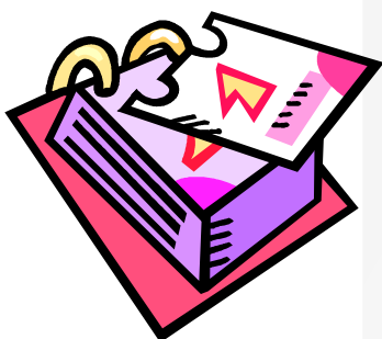
בתכנית השבוע: סיור, כנס ומפגש